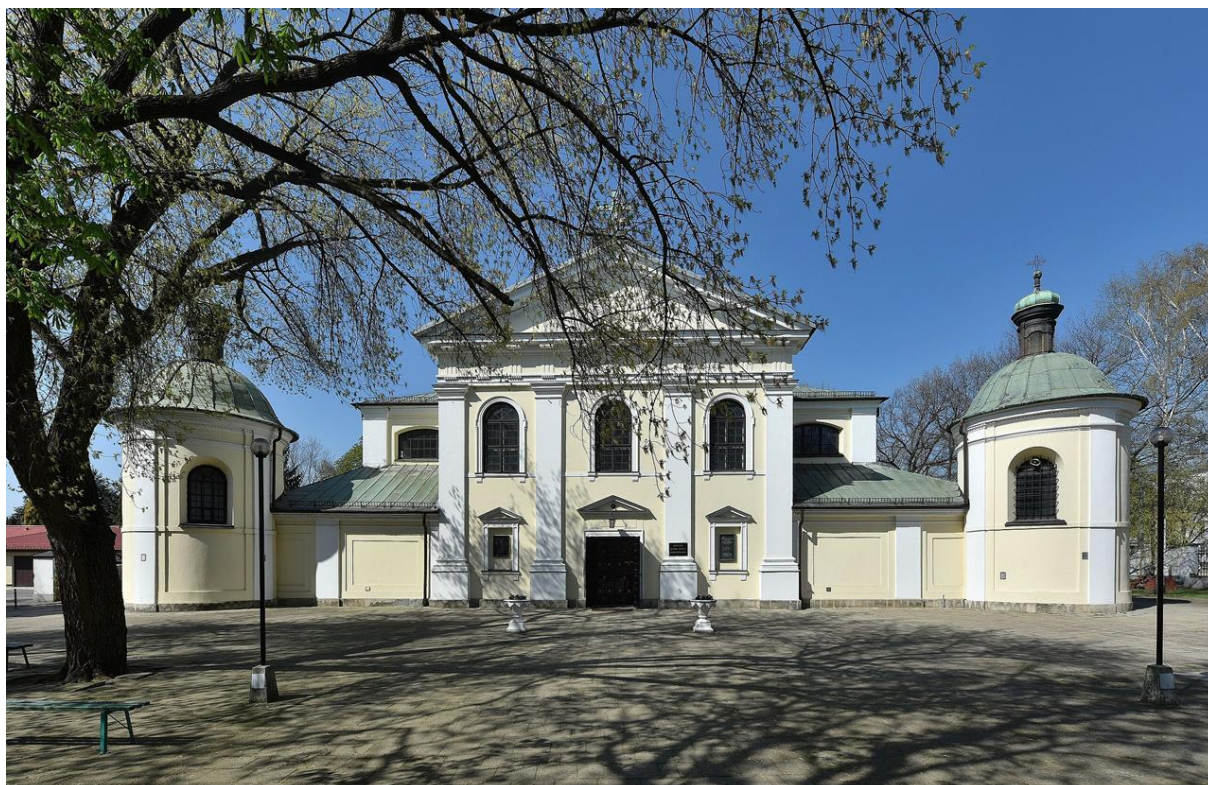
Kościół Matki Bożej Loretańskiej w Warszawie, fasada od strony południowej

Opracowali: mgr Karol Nawrocki, konserwator i restaurator dzieł sztuki mgr inż. Slavomir Mežanec, architekt, konserwator zabytków